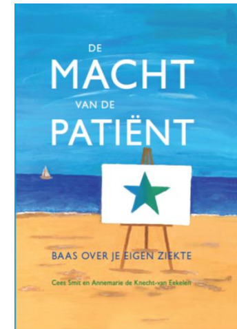
Boek van: Cees Smit, patient advocate, 2015