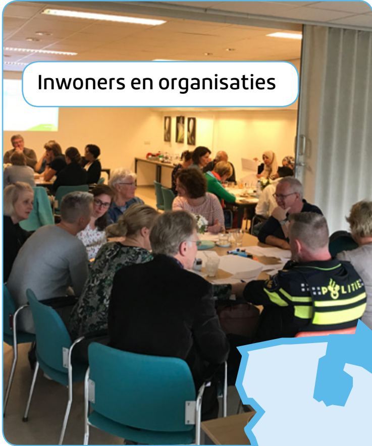
Inwoners en organisaties