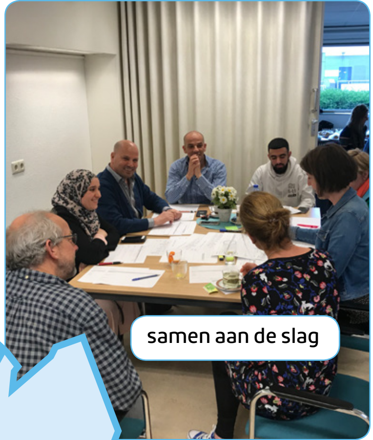
samen aan de slag