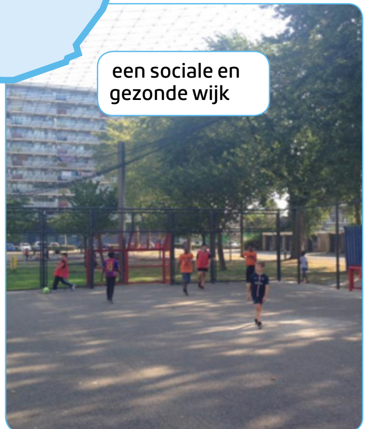
een sociale en gezonde wijk