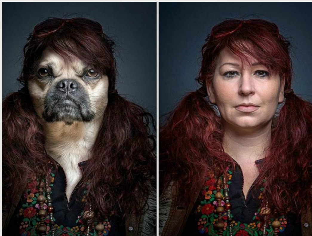
Bron afbeelding: underdogs door fotograaf/kunstenaar Sebastián Magnani